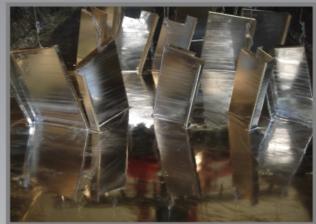
Stooss-Zinkschmelze, das geprüfte Naturprodukt.